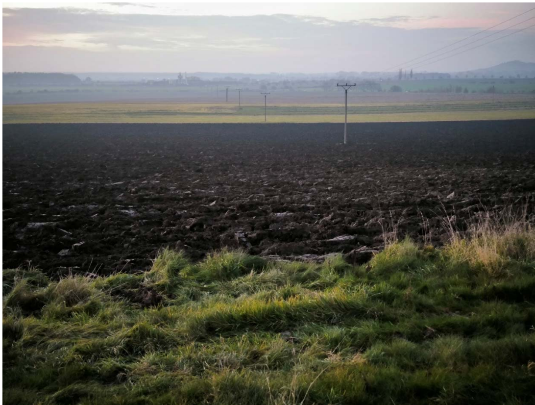
Obrázek 1 Pohled na pozemky pro biokoridor a biocentrum směrem na sever