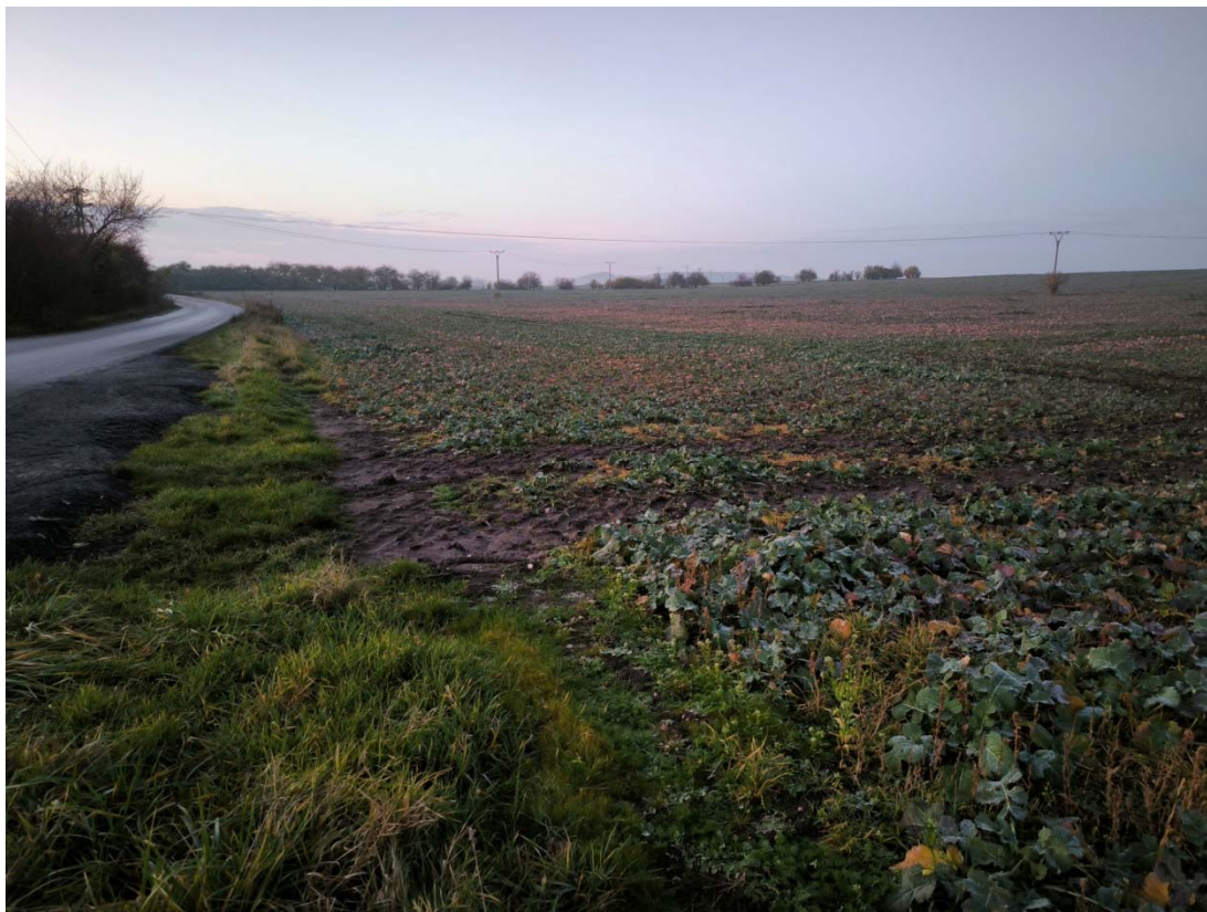
Obrázek 3 Pohled na pozemek pro biokoridor směrem na sever od silnice II/328