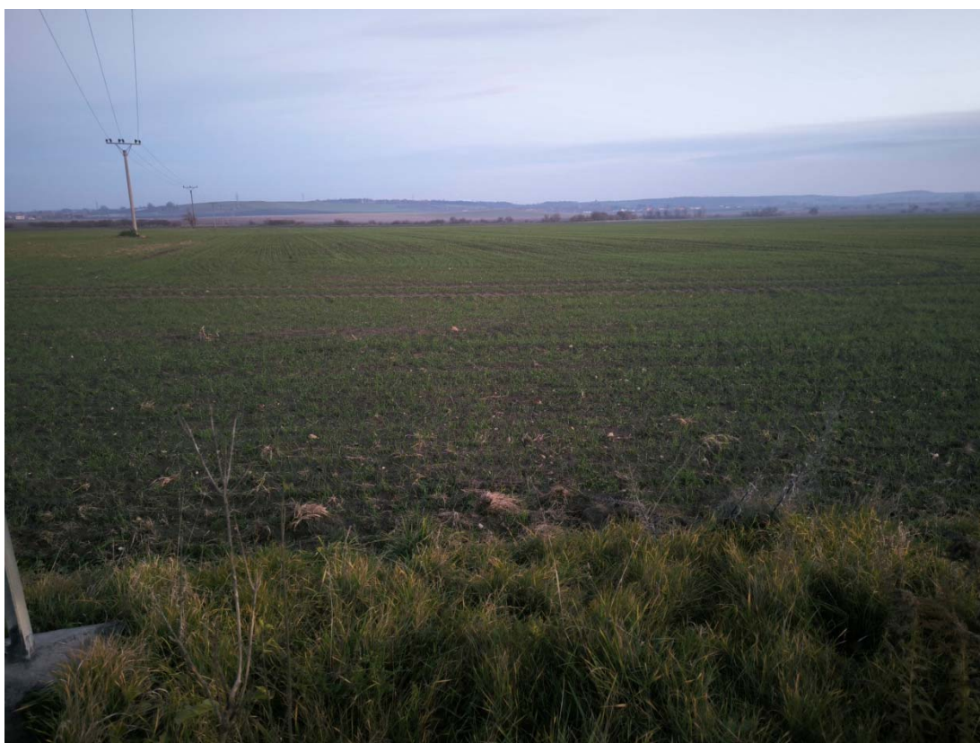
Obrázek 2 Pohled na pozemky pro biokoridor a biocentrum směrem na jih od silnice II/328